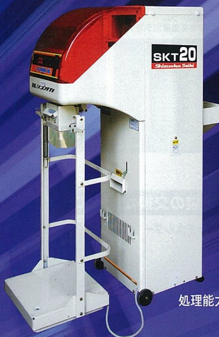
SKT20 処理能力 1,200kg/H (20俵/H)