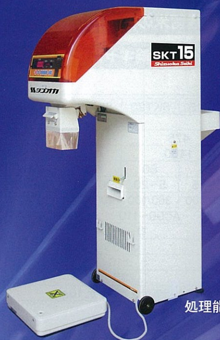
SKT15 処理能力 900kg/H (15俵/H)