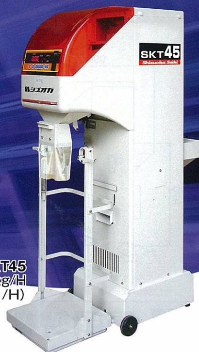
SKT45 処理能力 2,700kg/H (45俵/H)