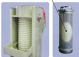
選別ドラム 3条多重選別ラセン