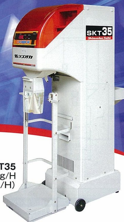
SKT35 処理能力 2,100kg/H (35俵/H)