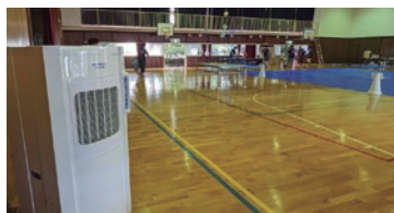
広くて暑い体育館などの熱中症対策