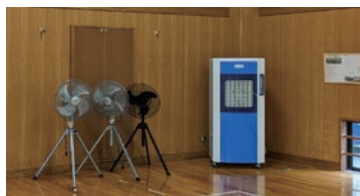
体育館などでの運動時