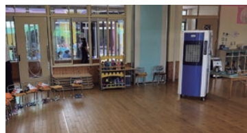
電気使用量を抑えられます