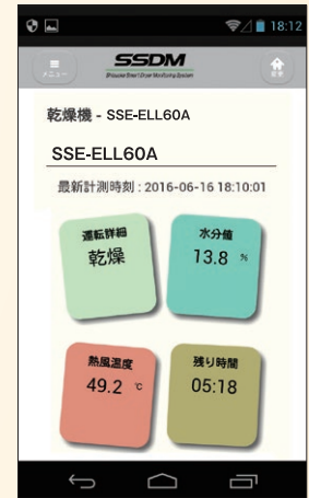
スマートフォン画面